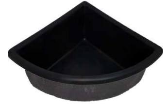
W-238 (90x90) Winkel