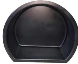
R-16 / R-17 Halbrund