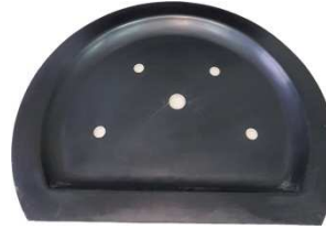
A-22 / A-23 Deckel