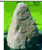
QU-ST-10 75x65xh100 267,00 €