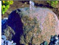
QU-ST-3 45x37xh27 97,00 €