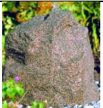
QU-ST-1 40x35xh43 97,00 €

BS: Sandoptik GS: granitgrau GR: granitrot