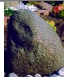
QU-ST-2 32x36xh38 77,00 €