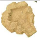
G101 78x70 132,00 €