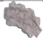
G107 104x58 132,00 €