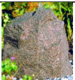
QU-ST-1 40x35xh43 97,00 €

BS: Sandoptik GS: granitgrau GR: granitrot