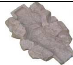
G104 99x61 132,00 €