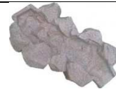
G106 110x66 132,00 €