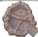
G102 90x78 132,00 €