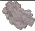
G103 101x62 132,00 €