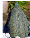
QU-ST-5 25x22xh42 77,00 €