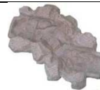
G105 107x65 132,00 €