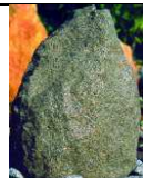
QU-ST-4 40x30xh62 115,00 €