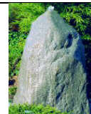
QU-ST-9 95x80xh155 935,00 €